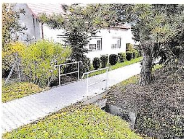
Mostík cez odvodňovací kanál, ktorý vedie pozdĺž juhovýchodnej hranice pozemkov parc. č. 158, 159