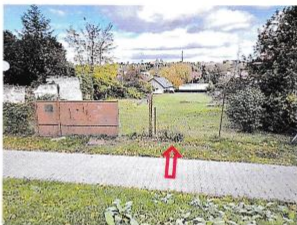
Pohľad na pozemky parc. č. 158, 159 od ulice Chorvátska