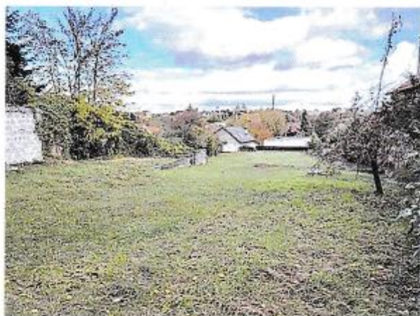
Ohodnocované pozemky parc. č. 158, 159