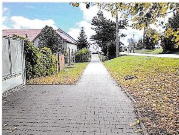
Pohľad na prístupovú komunikáciu