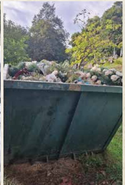
A takto to vyzerá, keď sa správame neohľaduplne.