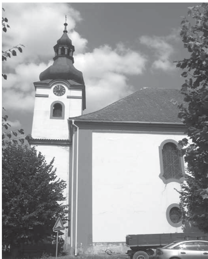
Kostol Sv. Petra a Pavla v Dolanoch u Klatov

Šumaváci. Túto prezývku sme si na chvíľu vyslúžili od našich kamarátov počas družobnej návštevy v Bolaticiach. Nechápacé pohľady s otázkou, prečo tak ďaleko, s ktorými sme sa stretli hneď pri prvom oznámení zámeru nášmu turistickému okoliu, má až dve správne odpovede.