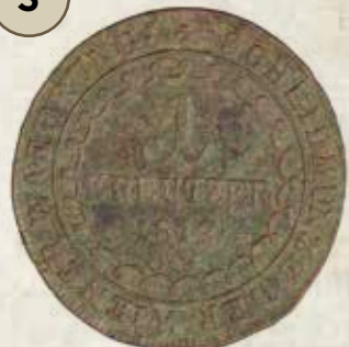
Rakúsko, František I. (1792 – 1835), Viedeň, 1 grajciar z r. 1812 Lit.: Jaeckel 1970, s. 96, č. 180 4,14 g