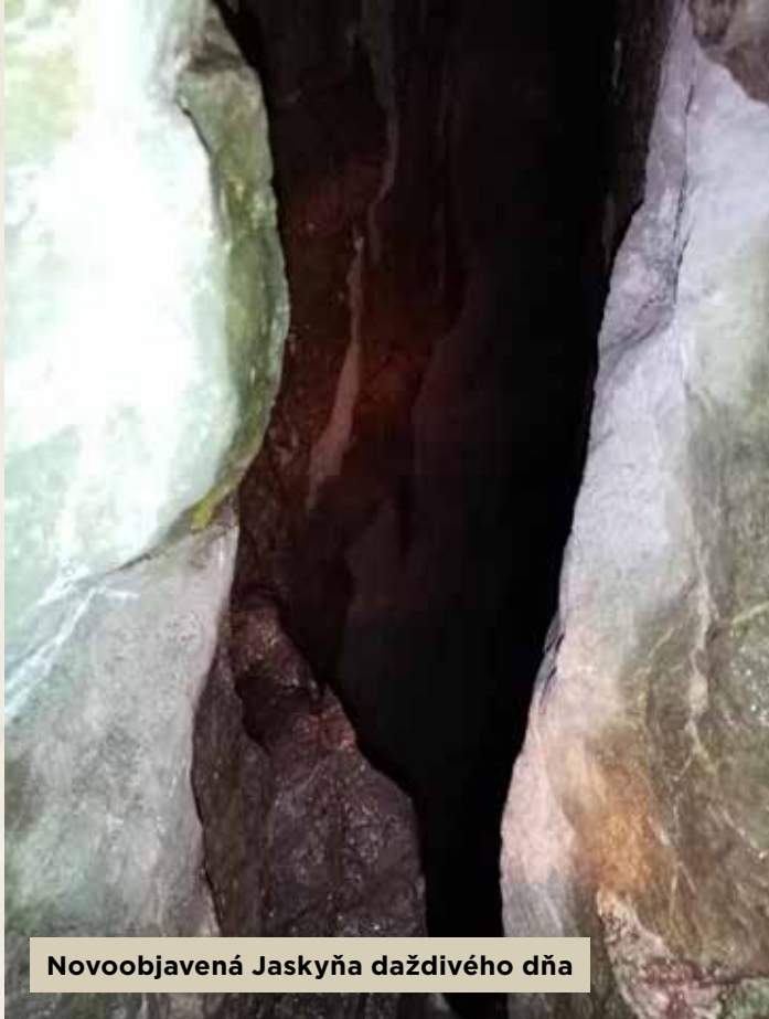
Novoobjavená Jaskyňa daždivého dňa

Na Slovensku je zaevidovaných viac ako 7000 jaskýň, v Malých Karpatoch je to viac ako 300. Od 13. októbra 2020 sa k nim pridala ďalšia jaskyňa, ktorá sa našla nad Doľanmi. Presnejšie sa nachádza nad Sklenou hutou a je súčasťou Kuchynsko-orešanského krasu. Názov jaskyne je Jaskyňa daždivého dňa , pretože bola zameraná počas upršaného dňa. Jej číslo je 7 586 a taký je aj počet jaskýň na Slovensku. Nová jaskyňa je dlhá 4 m, avšak podľa štátnych ochranárov prírody môže byť aj dlhšia. Zo začiatku je veľmi úzka, ale ďalej sa rozširuje.