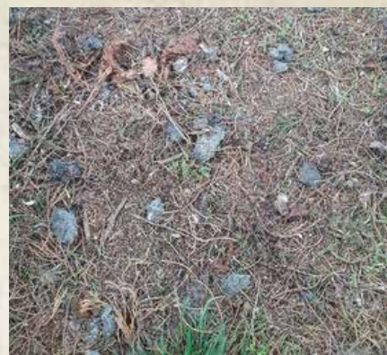
Neklamným znamením výskytu myšiарok sú tzv. vývržky – kúsky nestrávenej potravy.