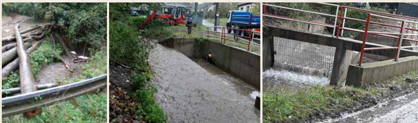
Aj vyťažené kmene stromov pod Zabítmym robili problémy.