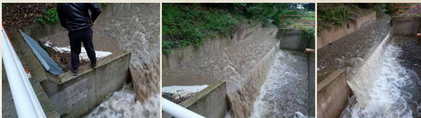
Naplavený štrk a iné nečistoty bolo nutné odstrániť.

Upršaná jeseň spolu s nadmerným úhrnom zrážok nám pripomenula veľkú vodu z roku 2011. Vďaka aktívnym protipovodňovým opatreniam sa podarilo odvrátiť hroziacu katastrofu.