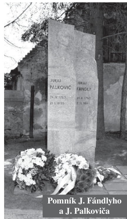
Pomník J. Fándlyho a J. Palkoviča

Juraj Palkovič, cirkevný hodnostár, vzdelanec širokého záberu, profesor morálky, prekladateľ filo-