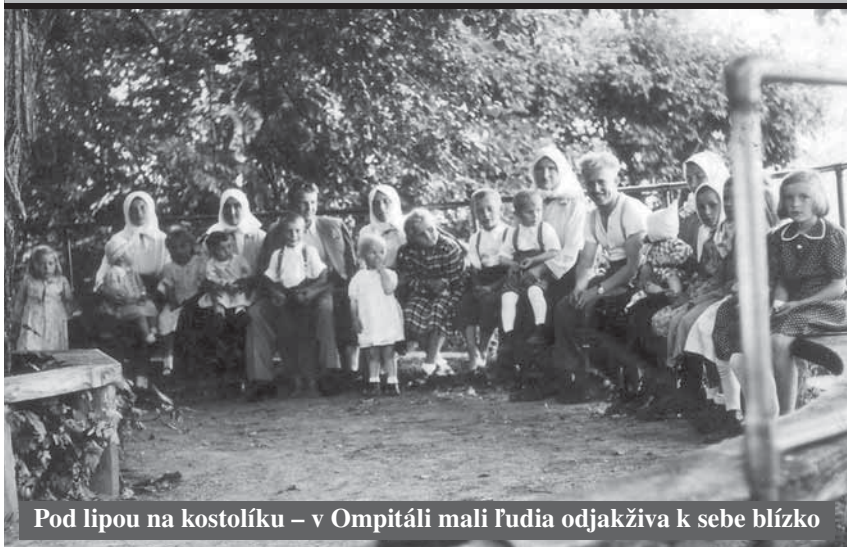
Pod lipou na kostolíku – v Ompitáli mali ľudia odjakživa k sebe blízko