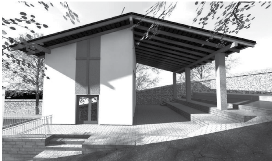
...a takto by mal vyzeráť po dokončení rekonštrukcie.

Vopred ďakujeme za všetky vaše príspevky.