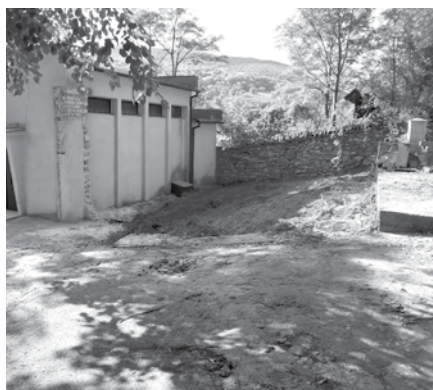
Takto vyzerá Dom smútku dnes...

Napriek tomu, že pôvodne plánovaný projekt prestavby Domu smútku sa pre vysoké vypočítané náklady (vyše 90 tisíc eur) nerealizoval, obec sa pustila do postupnej rekonštrukcie vlastnými silami a prostriedkami. Asi ste si už všimli, že priestranstvo za Domom smútku je už vyčistené a pripravené na výstavbu terasovitých schodov. Taktiež sa začalo s drobnými stavebnými prácami, čistením, odbúraním časti muriva, hotové sú zemné práce atď. Ak všetko pôjde dobre, celá stavba by mohla byť ešte v tomto roku pod novým prestrešením.