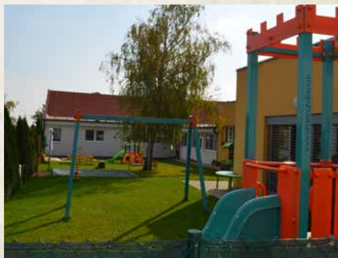
Rekonštrukcia a prístavba Materskej školy vrátane dvora