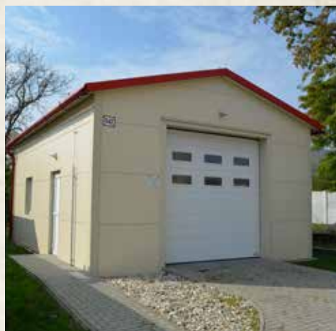
Fasáda materskej škôlky a vybudovanie skladu hasičskej výzbroje a výstroje