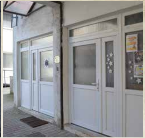
Výmena okien a dverí na budove obecného úradu a Dome kultúry J. Fándlyho