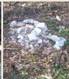
Nová „kôпка“ v Ampérovch pribudla pár dní po vyčistení priestoru

Likvidácia čiernych skládok je problémom, s ktorým obec neustále zápasia a stojí ich nemalé finančné prostriedky. Aby sa predišlo ich vzniku, niektoré obce umiestnili na exponované miesta fotopasce, ktoré dokumentujú pôvodcov skládok a majú aj preventívny charakter. Nelegálne skládky vznikajú v Doľanoch napr. pod vinohradmi smerom na Častú a v spodnej časti Ampérov, kde pár dní po odstránení čiernej skládky (obsahovala igelity, fľaše, staré hrnce, plastové fľaše a pod.) pribudla nová kôпка stavebného odpadu. V prípade, že sa bude situácia opakovať, obec využije všetky dostupné prostriedky, aby sa takémuto konaniu zamedzilo a pôvodcovia tohto odpadu zodpovedali za svoje nerozumné konanie. (dd)