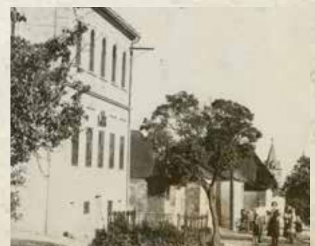
Ompitálska škola zač. 30. rokov.