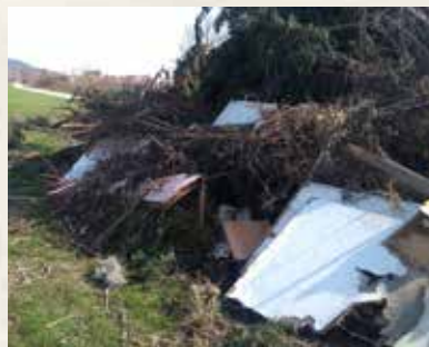
Pôvodca tohto odpadu sa zrejme domnieval, že odpad zhorí spolu s révou a bude po probléme.