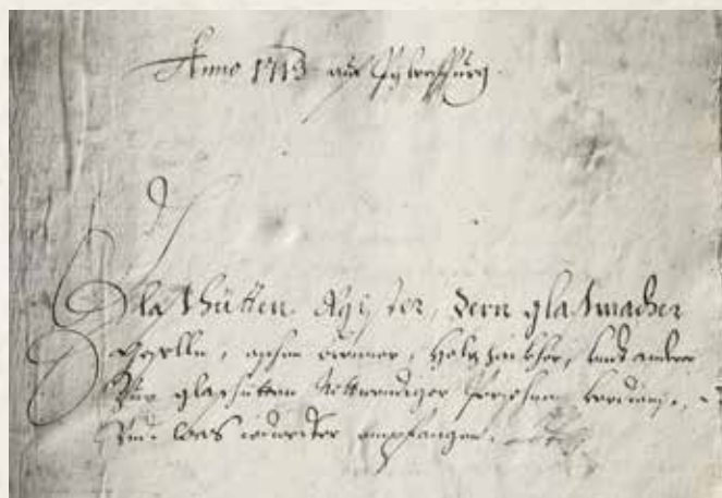
Sklársky register z roku 1713 (Slovenský národný archív)

Podľa urbára panstva z roku 1704 prinášala skláreň ročný príjem pre panstvo Červený Kameň 200 zlatých. Pre porovnanie sklárne nad Jablonovým mala v tom istom roku výnos 4 000 zlatých. Sklárne si teda vzájomne konkurovali. Až uzavretie sklárne nad Jablonovým po roku 1713 viedlo k renesancii a udržaniu sklárskej výroby v Doľanoch, kde vznikli Nové hute ( Neÿen Glosszhütten ). Nové hute boli v prevádzke až do polovice 18. storočia, keď bola skláreň pre nerentabilitu uzavretá.