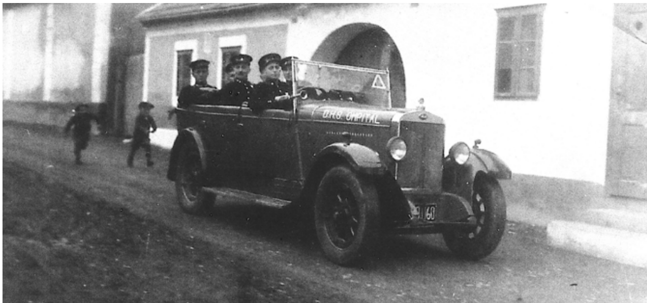
Paráda ako sa patrí: dolianski hasiči vo svojom najkrajšom aute

Dobrovoľný hasičský zbor v našej obci sa môže pochváliť veľmi bohatou a zaujímavou históriou - jej symbolom je dodnes unikátna vlajka. Teší nás, že sa stále nájdu ľudia, ktorí tento symbol dokážu hrdo a zodpovedne niesť ďalej. Obrazne i doslova.