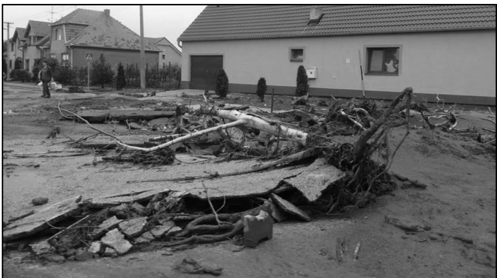
Jún a november 2011 alebo doliansky Fénix pred zrkadlom