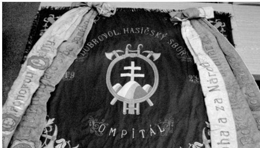
Vzácná relikvia z roku 1929: hasičská vlajka a mená vtedajších „sponzorov“ na žrdi

Veríme, že si túto zaujímavú akciu nenecháte ujsť a prídete tak vzdať hold príslušníkom nášho hasičského stavu za všetko, čo pre obec robia na úkor svojho voľného času. Srdečne pozývame!