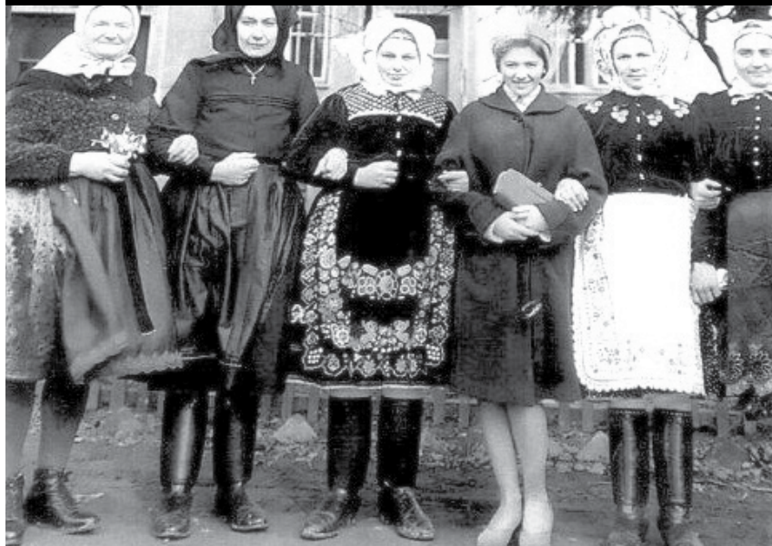
Poznávate ženy na obrázku? Ompitálčanky sa vždy vedeli parádne vystrojiť a vždy držali spolu. Tie dnešné sa už tri roky stretávajú v Dámskom klube. Viac sa dočítate na strane 12.

Slovom a obrazom o živote a ľuďoch v Ompitáli