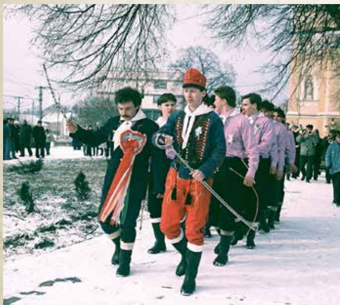
Foto: Fašiangový sprievod v Chtelnici, 1980