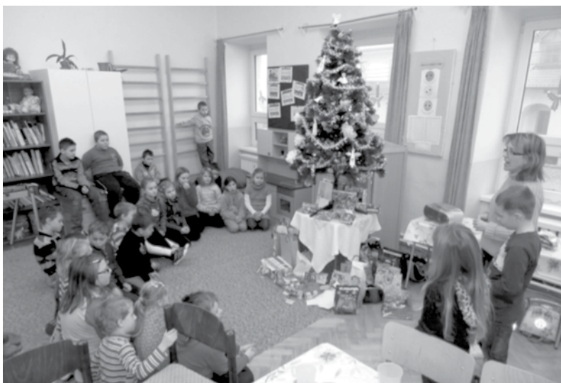
Vianoce v škole: krásna atmosféra pri stromčeku s darčekom