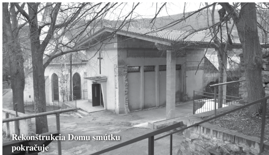
Rekonštrukcia Domu smútku pokračuje

Vopred ďakujeme za všetky vaše príspevky.