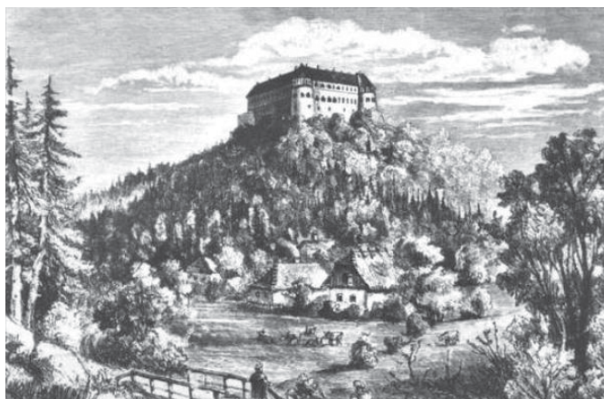
Hrad Červený kameň a jeho páni určovali život aj v našej obci