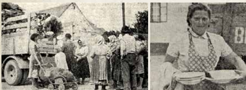
Výkup starého textilu v Dolanoch v roku 1958

... to bola voľakedy veľká udalosť. Prinesené staré oblečenie – handry vymieňali za všakovaké lacné drobnosti – guľôčky, korálky a podobne. Tento „obchod“ bol značne nevýhodný pre majiteľov starého textilu. Už vtedy sa vedelo, že odpad je surovina, ktorá má svoju hodnotu a bolo treba zakročiť. Vtedajší národný podnik Zberné suroviny pripravil zberové akcie po dedinách. A ako taká akcia prebiehala v roku 1958 v Dolanoch? To si priblížime v nasledujúcom článku.