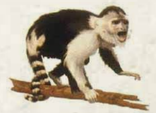
Branisella boliviana - prehistorický primát nesie meno svojho objaviteľa