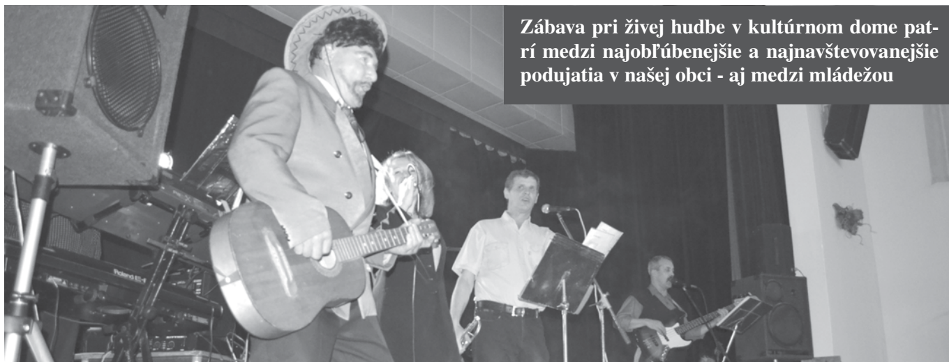
Zábava pri živej hudbe v kultúrnom dome patrí medzi najobľúbenejšie a najnavštevovanejšie podujatia v našej obci - aj medzi mládežou

V našej obci žije vyše tisíc obyvateľov a nemalú časť z toho tvoria mladí ľudia. Práve ich sme sa pýtali, čo sa im na našej obci páči a čo by chceli zmeniť.